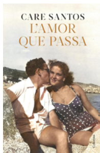
L'Amor que passa