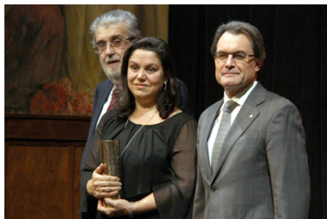
Concedició del Premi Ramon Llull 2014. Desig de xocolata. @ 22/5