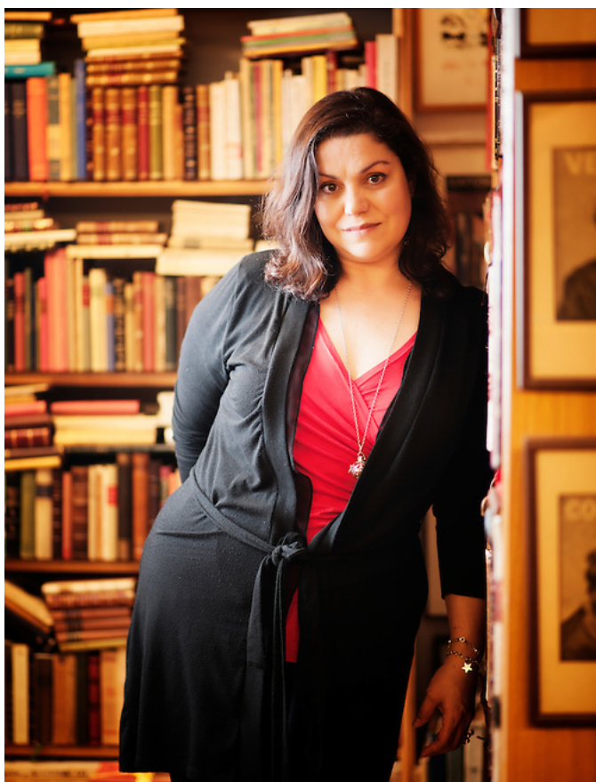
Barcelona, 2013. L'aire que respire. @ 22/5

cava una revista en format gairebé de llibre, Caminos ; es convocaven concursos, actes i congressos a Alcalá de Henares als quals assistien autors força reconeguts del moment –recordo Arturo Pérez Reverte, Luís Landero, Robert Sala-drigas... i un jove Juan Manuel de Prada que presentava una primera edició del seu radical i alhora poderós llibre Coños , en format gairebé marginal, que vaig llegir i guardar anys – i amb els quals interactuàvem i ens reuníem. Un punt de confluència cultural del qual em sento plenament deutor.