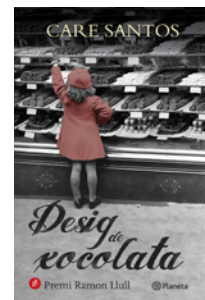
Desig de xocolata