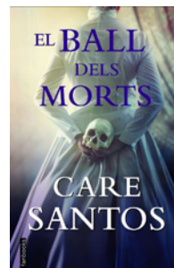
El Ball dels morts