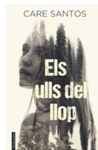
Els Ulls del llop