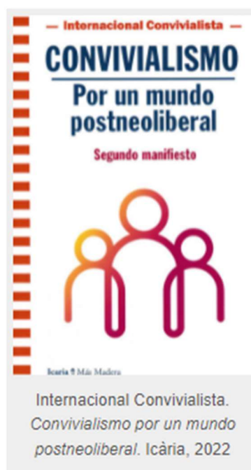
Internacional Convivialista. Convivialismo por un mundo postneoliberal . Icaria, 2022