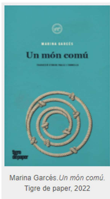
Marina Garcés. Un món comú . Tigre de paper, 2022

Si voleu aprofundir en aquest ideari, us proposem la lectura d'alguns llibres i autors que basen la seva argumentació en la necessitat de trobar totes les formes possibles de la cooperació social per esdevenir autosuficients col·lectivament. A la Biblioteca de Cardedeu, trobareu una selecció amb pensadors com Marina Garcés, Noam Chomski, Dean Spade, la Internacional Convivialista i tants altres autors que es qüestionen com millorar l'organització social argumentant la necessitat de redefinir aquesta nova forma de convivència: