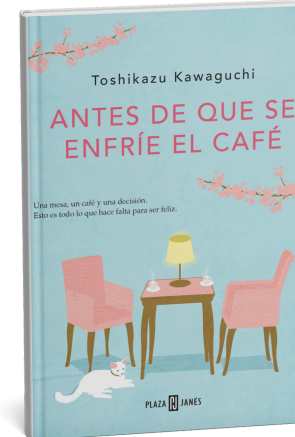
Antes de que se enfríe el café. Toshikazu Kawaguchi. Plaza & Janés, 2021.