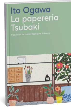
La papereria Tsubaki. Ito Ogawa. Navona, 2024.