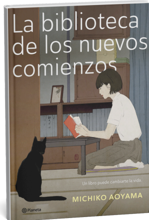
La biblioteca de los nuevos comienzos. Michiko Aoyama. Planeta, 2023.