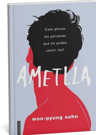
Ametlla. Won-Pyung Sohn. Fanbooks, 2020.