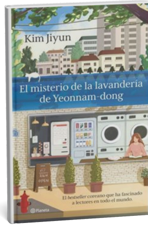
El misterio de la lavandería. Yeonnam-dong. Planeta, 2025.