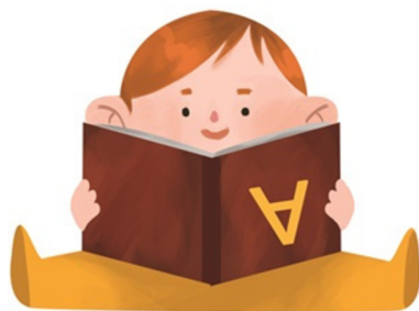
Il·lustració de Marina Vidal

A totes les Biblioteques Municipals de Sabadell hi trobareu llibres recomanats per als infants fins als 3 anys, identificats amb l'imatge del nadó lector, i ubicats a la zona de Petits Lectors.