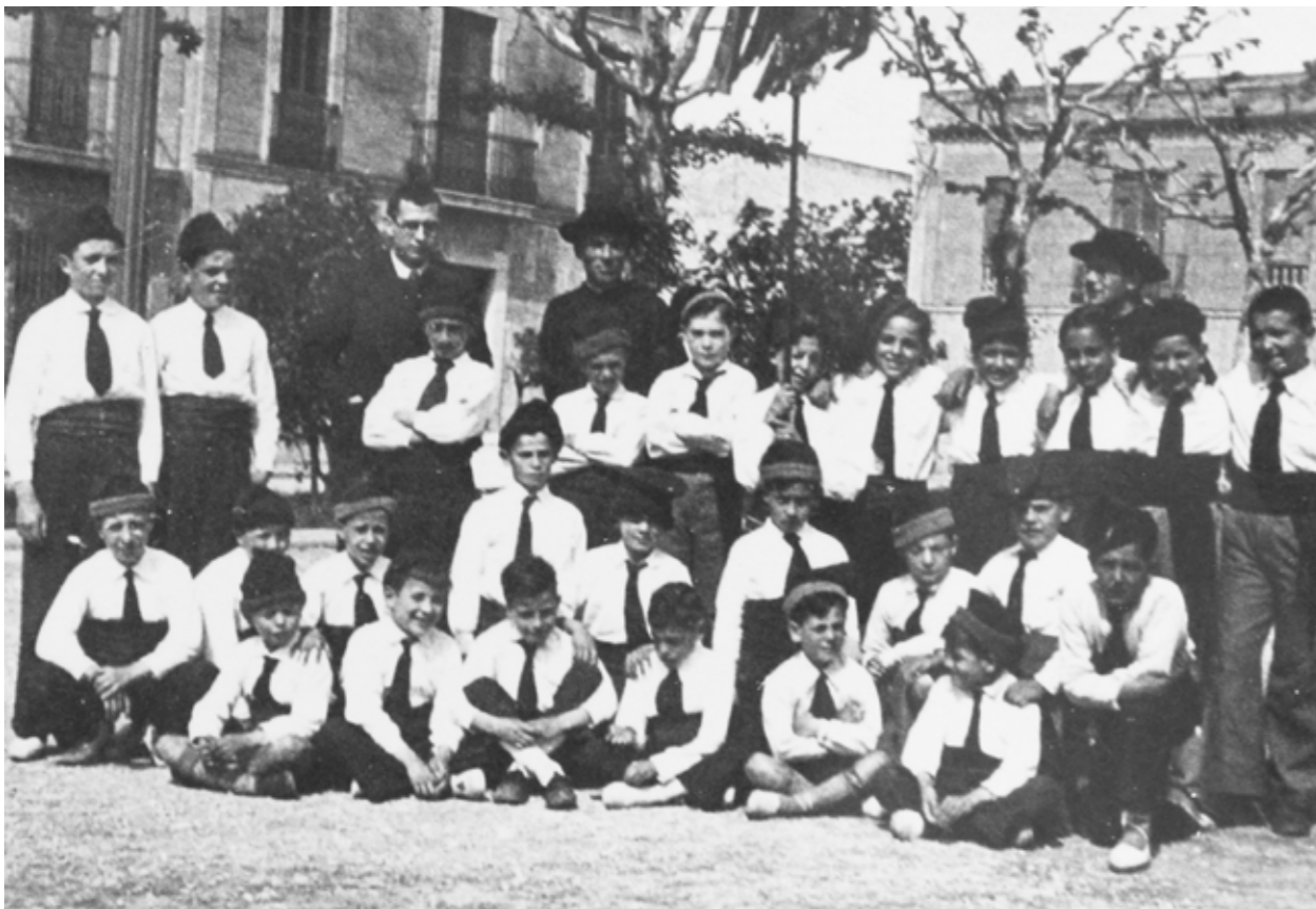
Caramelles del Centre Social cap a 1935.