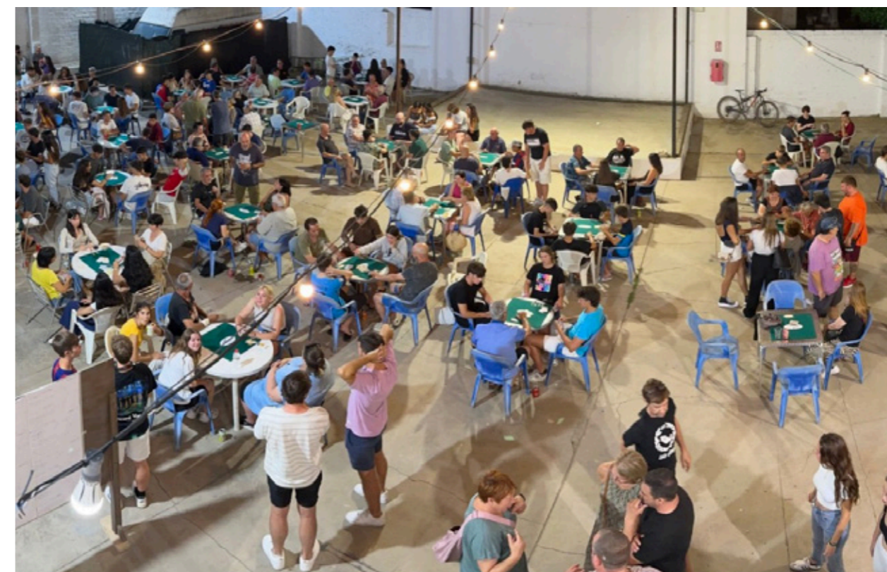
Campionat de truc al Pati del Centre Parroquial. Juliol de 2024.