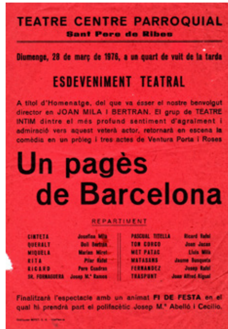
"Un pagès de Barcelona", representada el 21 d'abril de 1974 i el 28 de març de 1976.

Al Butlletí núm. 1 de L'Esquellot, Centre Social Ribetà, declaren: "Hem format una societat, i la nostra comesa no és de competició, ni de rivalitat, ha d'ésser de complementació de la nostra formació personal". Com hem comentat en relació a l'entitat GER, les vivències de cadascú expliquen que les versions dels implicats no sempre coincideixin.