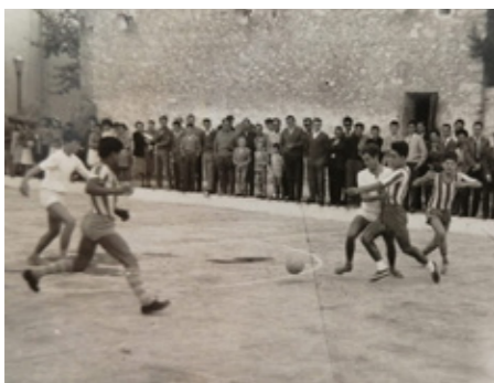
Partit de futbol sala la temporada 1963-1964

Al 1969 s'eliminen les llotges, es fan lavabos nous i una caseta per a la calefacció. S'ha conservat la instància del permís i diversos croquis.