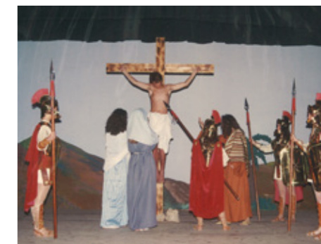
Una de les fotografies de l'Àlbum de la Passió.

El gruix cultural el completen els 27 anys ininterromputs de Campionat de Truc, els tradicionals concerts d'havaneres i el Carnaval.