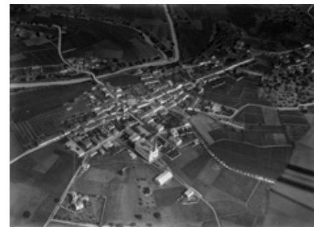
Fotografia aèria de Ribes vers l'any 1921. A l'ampliació es veuen les parets del Centre Parroquial en construcció.