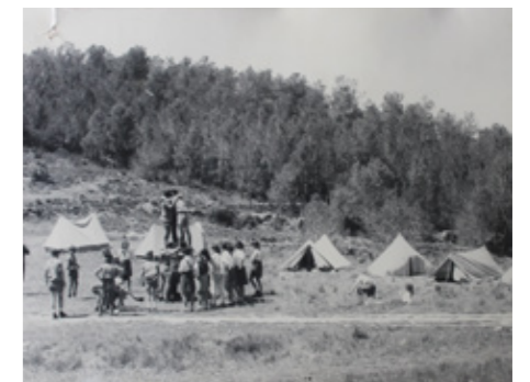
Campament d'escoltes a Olivella. Fent una petita torre.