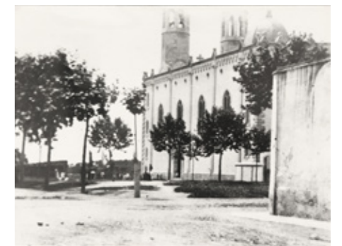
Entrada d'una processó per la porta lateral de l'església abans de la construcció del Centre Parroquial, vers 1915.