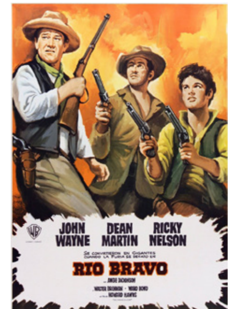
Cartell de "Río Bravo" (1959). La sala de cinema es coneix al poble com "Can Pistoles".

La situació farà que amb el temps un grup important d'aquests