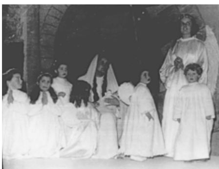
"L'estel de Natzaret". Pastorets de 1957.