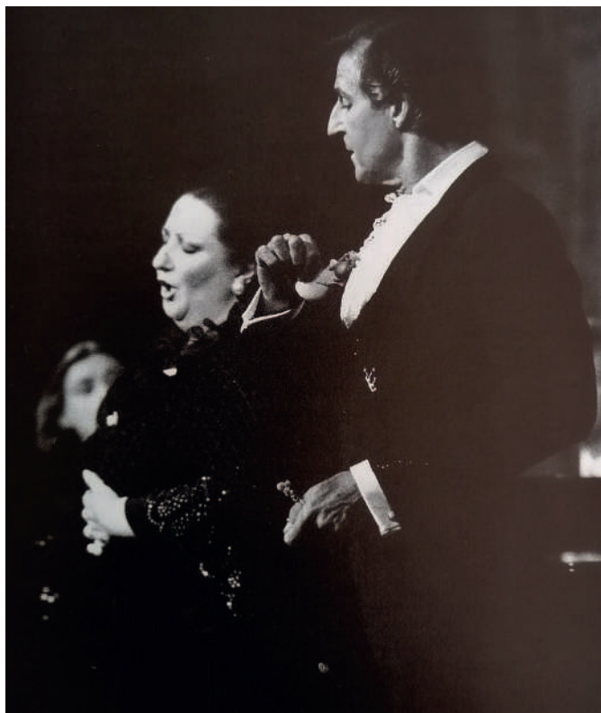
Dos artistes catalans que també van actuar plegats, Montserrat Caballé i José de Udaeta

1977-78. Gira a duo amb Montserrat Caballé per les principals sales d'Europa: La Scala de Milà, Royal Opera House Covent Garden de Londres o Bayerische Staatsoper Nationaltheater de Munich, entre d'altres.