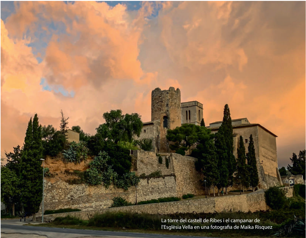
La torre del castell de Ribes i el campanar de l'Església Vella