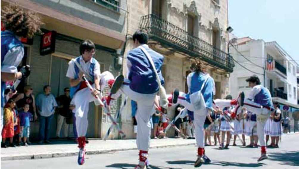
Ballant a la sortida d'ofici de Sant Pere del 2013. Autora: Clàudia Franco.

El Ball de Pastorets és un ball parlat amb coreografia, propi del model festiu de la Catalunya Nova. Els versos parlen sobre la vida dels pastors en grup a la muntanya, dels quals en destaquen dos: el majoral i el rabadà. El majoral és el cap dels pastors i el rabadà és el pastor més petit i inexpert. En el cas de Ribes, els pastors de la colla carreguen contra el rabadà, ja que aquest no fa les feines que ha de fer o les fa amb poca traça. Al final, el majoral acaba perdonant el rabadà, que recita un vers desitjant bona festa major des de dalt dels garrots.