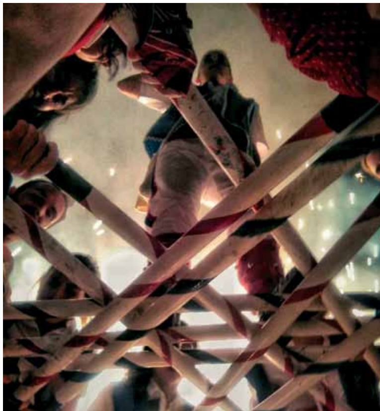
Ballada conjunta de final de festa per Sant Pere del 2018. Autor: Roger Serra