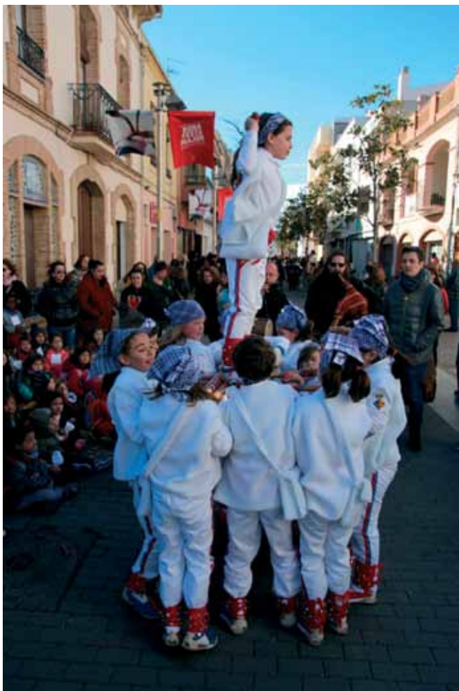
L'actual colla infantil, per Sant Pau del 2019.

Sembla que el futur del Ball a Ribes està assegurat, com a mínim amb el model actual dels balls infantils. I que per molts anys més n'hi pugui haver!