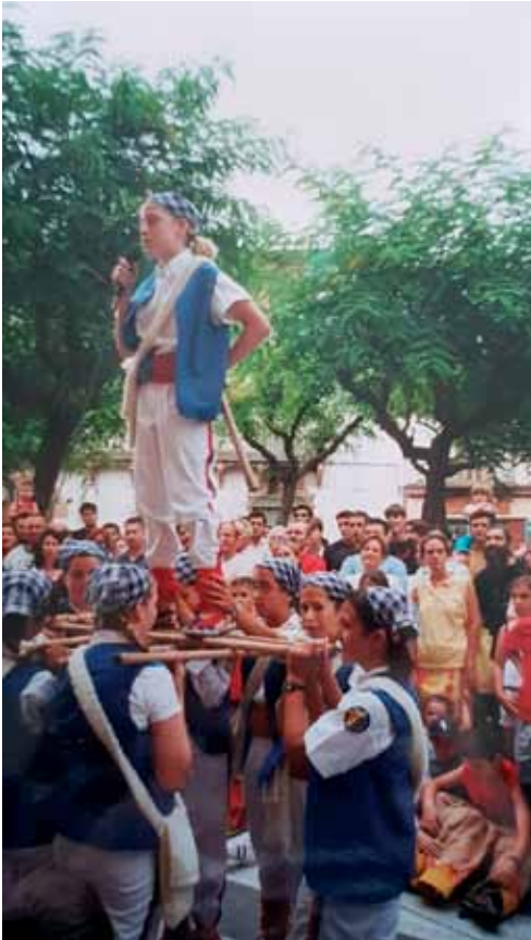
La figura en què el rabadà recita el vers des de l'estructura formada pels pals es coneix com a bota. A la foto, l'exhibició de Sant Pere del 2002. Autor: Enric Bartra.

Aquestes quatre evolucions es podien ballar seguides o per separat, segons convingués. El ball era molt simple i es feia amb la música del Ball de Pastorets de Sitges, que és la que avui es pot escoltar a totes les poblacions, tret de Reus.