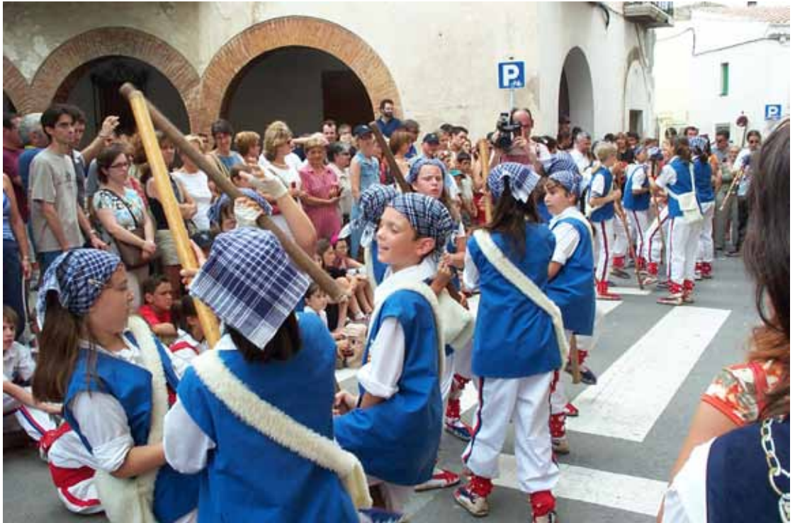
Sant Pere 2004. Exhibició conjunta de la colla actual (en primer pla) amb l'adulta (al fons).