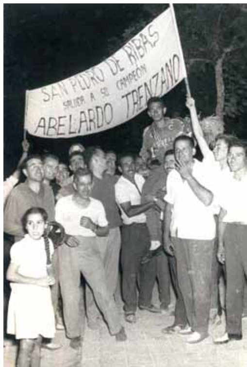
14 d'agost de 1960 a la plaça Marcer, celebrant la gran victòria del Campionat de Catalunya de Vallmoll.

havia cap rival capaç de frenar-lo. Va arribar a proclamar-se campió de Catalunya de la categoria. Aquesta va ser una de les carreres més importants, i molts aficionats ribetans van anar fins a Vallmoll (Tarragona) per poder veure'l. Era el 14 d'agost de 1960, mentre esperaven allà, preguntaven als corredors qui guanyaria la cursa, aquests els contestaven "el caballo loco" i així va ser. De tornada a Ribes, tot el poble l'esperava per poder celebrar aquella victòria davant del Quo Vadis, amb pancartes i cridant. Va ser un dia de celebració que encara avui el recorden com si fos ahir.