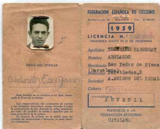
La llicència federativa en la categoria juvenil de l'any 1959.