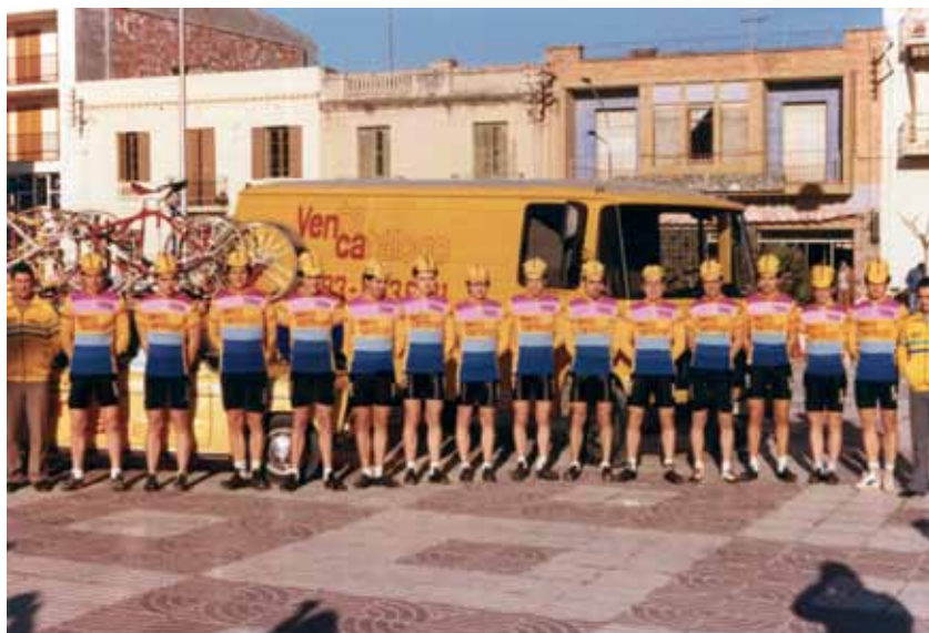
L'equip amateur del C.C. Ger, l'any 1984 a la Plaça Marcer.