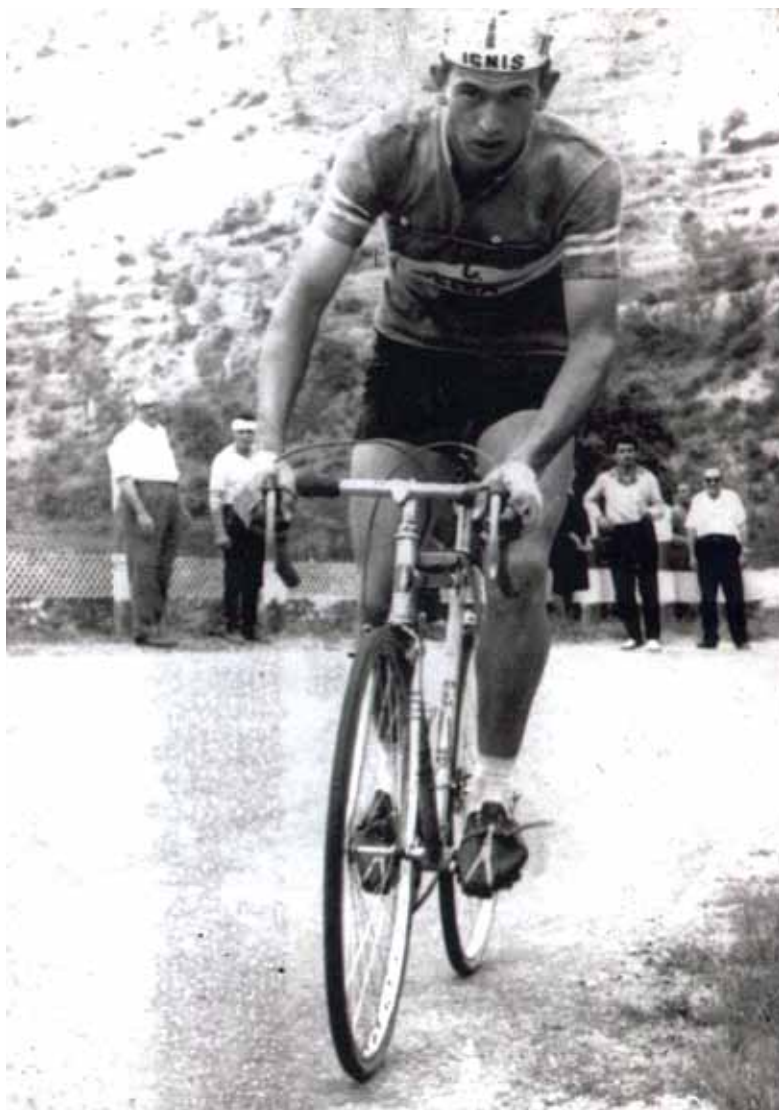
Cursa de l'any 1962, l'Abelard arribant a Canyelles.

Escriure aquest text no ha estat gens fàcil. Veure les persones com t'expliquen les experiències viscudes d'aquella època i tu, que has nascut en un moment on tot és tan diferent! intentes posar-te en el seu lloc per poder transmetre el text amb les mateixes emocions amb què t'ho expliquen, però creieu-me, és molt més delicat del que sembla!