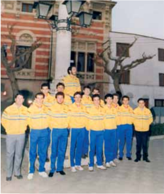
L'equip amateur del C.C. Ger a la plaça de la Vila.