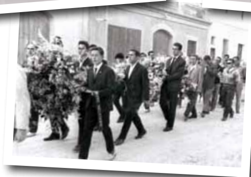
L'enterrament de l'Abelard, amb multitud de persones de Ribes, corredors del ciclisme català, dirigents dels equips i representants de Federació.

Al cap d'unes hores, la notícia de la mort de l'Abelard ja havia arribat al seu poble. Mai abans s'havia viscut un impacte com aquell. Només tenia 20 anys i moltes ganes de seguir competint, per això, el poble va abocar-se en l'enterrament al qual va assistir tota la gent de Ribes. El record d'aquell fet s'ha anat mantenint tot i el pas dels anys.