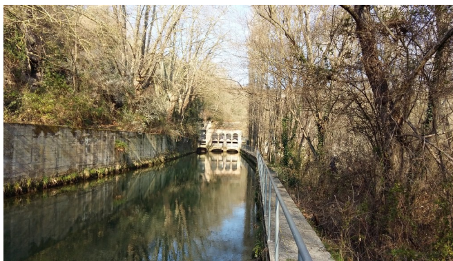
Parc Fluvial Llobregat - 11416 de Places & Activitats

Biblioplaça: CUINA DE QUARESMA EN DIRECTE. Com a preludi de Setmana Santa, el Mercat del Pagès oferirà cuina tradicional catalana en directe. Diversos restaurants vicentins cuinaran receptes de Quaresma elaborades amb productes de temporada i proximitat. Les Voltes anirà al Mercat i us oferirà un tast dels millors llibres per a totes les edats relacionats amb la cuina tradicional catalana, l'hort i els productes de proximitat i km0. Us podreu endur en préstec receptaris, contes per a compartir en família i revistes. Els més menuts podran resoldre sopes de lletres, pintar dibuixos i conèixer els productes de temporada tot jugant. Cada dissabte, a les 11 h explicarem un "Conte en 5 minuts". A càrrec del personal de la biblioteca. A l'estand de la Biblioteca Les Voltes al Mercat del Pagès