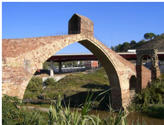
"IMG2382" de Charles Laine

Vet aquí una vegada... (+3 anys): DE L'HORT... AL CONTE! Una estona de lectura de contes en veu alta a la sala infantil. A càrrec de la Biblioteca. Lloc: Sala infantil. Activitat recomanada per a nens i nenes a partir de 3 anys. Entrada lliure. Aforament limitat