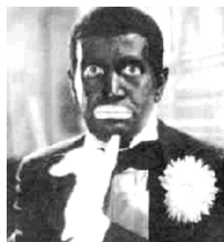
El cantor de Jazz

Les grans estrelles de la comèdia musical dels 30's van ser Fred Astaire i Ginger Rogers, Diana Durbin, i Busby Berkeley, entre d'altres. Entre els millors musicals de l'època hi ha "La viuda alegre" (1934), "Nacida para la danza" (1936), "Sombrero de copa" (1935), i "El mago de Oz" (1939).