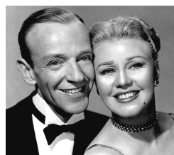
Sombrero de copa

Durant la postguerra va néixer un nou concepte, que va incloure el color i més presència a la quotidianitat en els arguments. Astaire va seguir ballant fins a la dècada de 1950 i la seva silueta es va fondre amb la del seu successor, Gene Kelly. Ell i els directors Stanley Donen i Vincente Minnelli van ser les figures més importants durant l'últim període del gènere. D'aquesta època són films com ara "Un día en Nueva York" (1949), "Un americano en París" (1951) i "Papá piernas largas" .