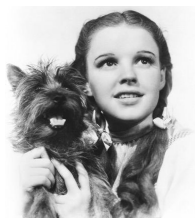
El mago de Oz