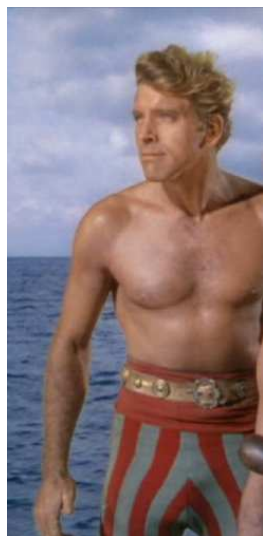
Burt Lancaster ( El temible burlón )