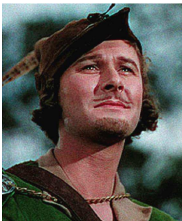
Errol Flynn ( Robin de los bosques )

Un trajecte ple d'obstacles que s'assembla a vegades a un recorregut iniciàtic (l'acció)