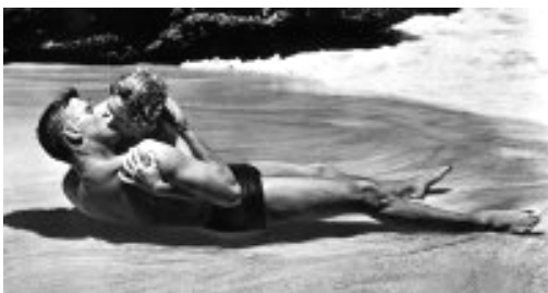
De aquí a la eternidad

La història d'amor en el cinema només té una regla d'or: que la relació amorosa mai no s'esdevingui suaument; només quan la parella les ha passat ben magres, té dret a fer-se un petó final apassionat.